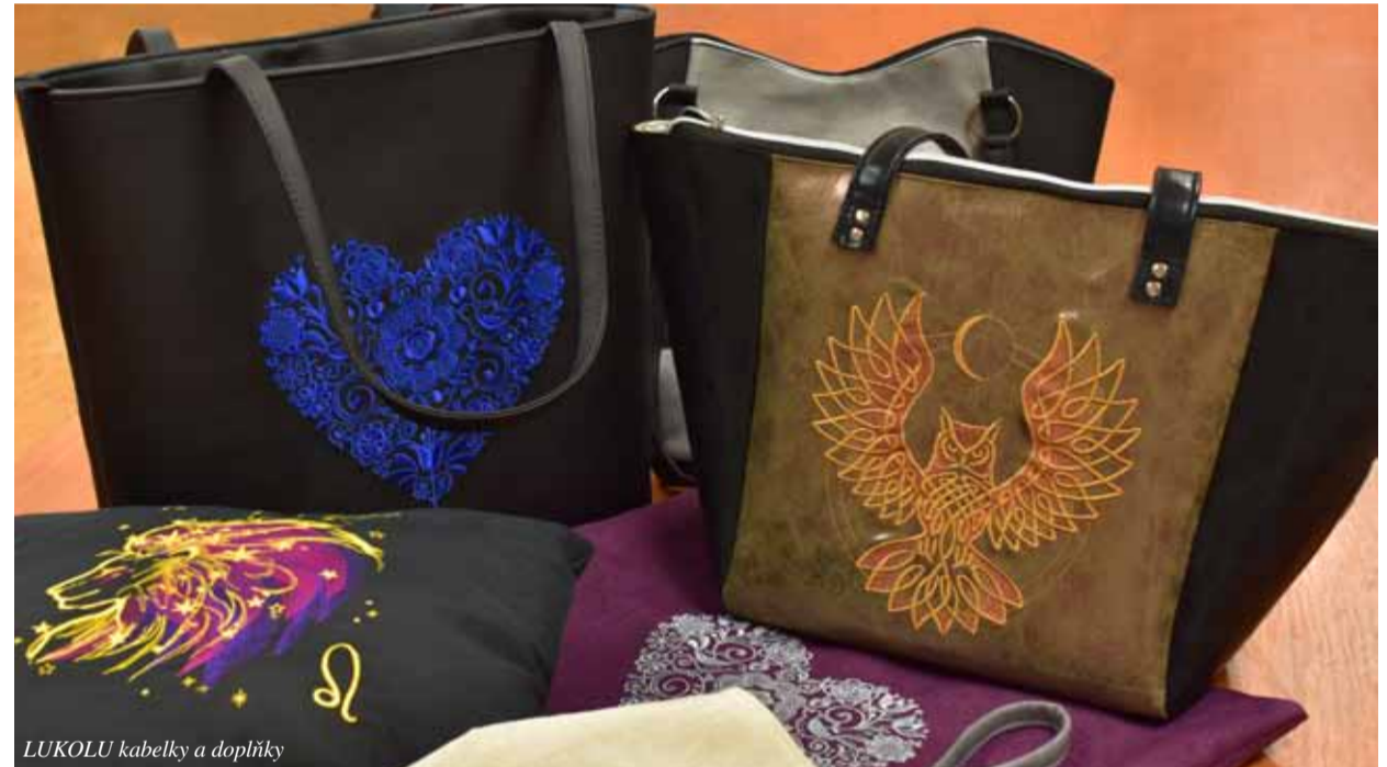
LUKOLU kabelky a doplňky

dičních rodinných receptur a bez zbytečné chemie, konzervantů a barviv. Zpracovávají plody, které na Horeckém Dvoře dozrají, nebo bylinky, které zde pěstují. Džemy vyrábějí pouze s pektinem z ovoce, sirupy z pečlivě připravovaných bylinných výluhů nebo ovocných šťáv. Sušené „Horecké plody“ suší z vlastního BIO ovoce a ořechových plodů. Štrúdláky jsou pasterizovaná nastrohaná jablka připravena pro celoroční použití do jablčného štrúdlu nebo jiných dobrot ze strouhaných jablek.