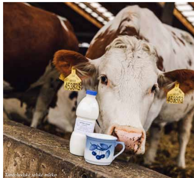
Tuněchodské selské mléko

Kabelku vám sladí s taštičkou, klíčenkou nebo látkovou taškou na příležitostný nákup. Vždy je vyroben pouze jeden jediný kus. Zaručuje jedinečnost vyšivky a zvolené barvy podle požadavků zákazníka. Nepotkáte ženu se stejnou kabelkou. Na výrobky používá kvalitní materiály včetně nití. Při výrobě ráda hledá inspiraci v přírodních a folklórních motivech. Pracuje v malé dílně rodinného domku v Ronově nad Doubravou.