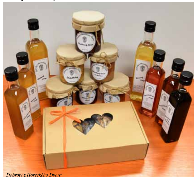
Dobroty z Horeckého Dvora