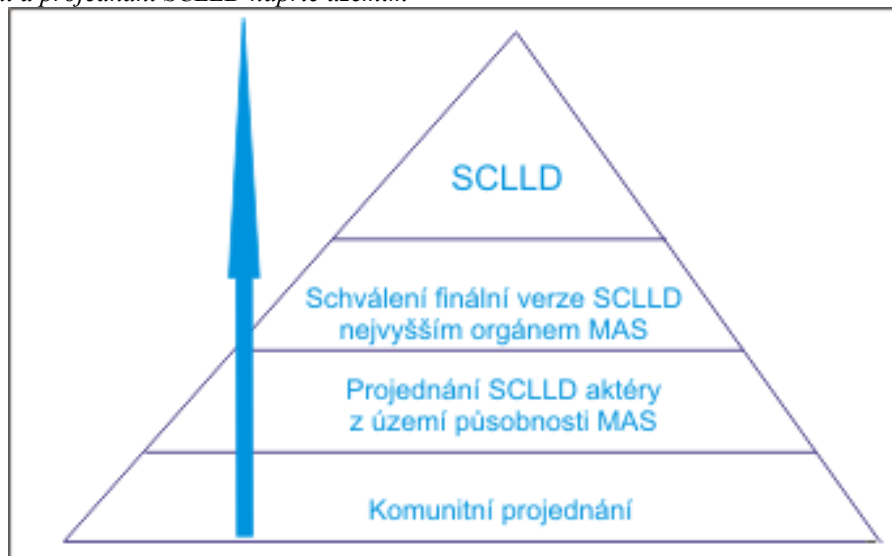
Graf 1 Zpracování a projednání SCLLD napříč územím