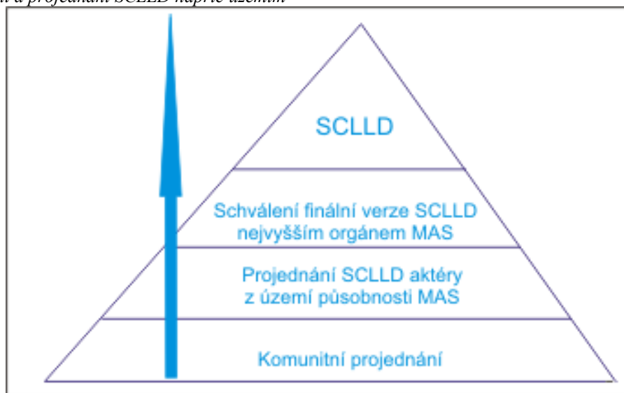
Graf 1 Zpracování a projednání SCLLD napříč územím